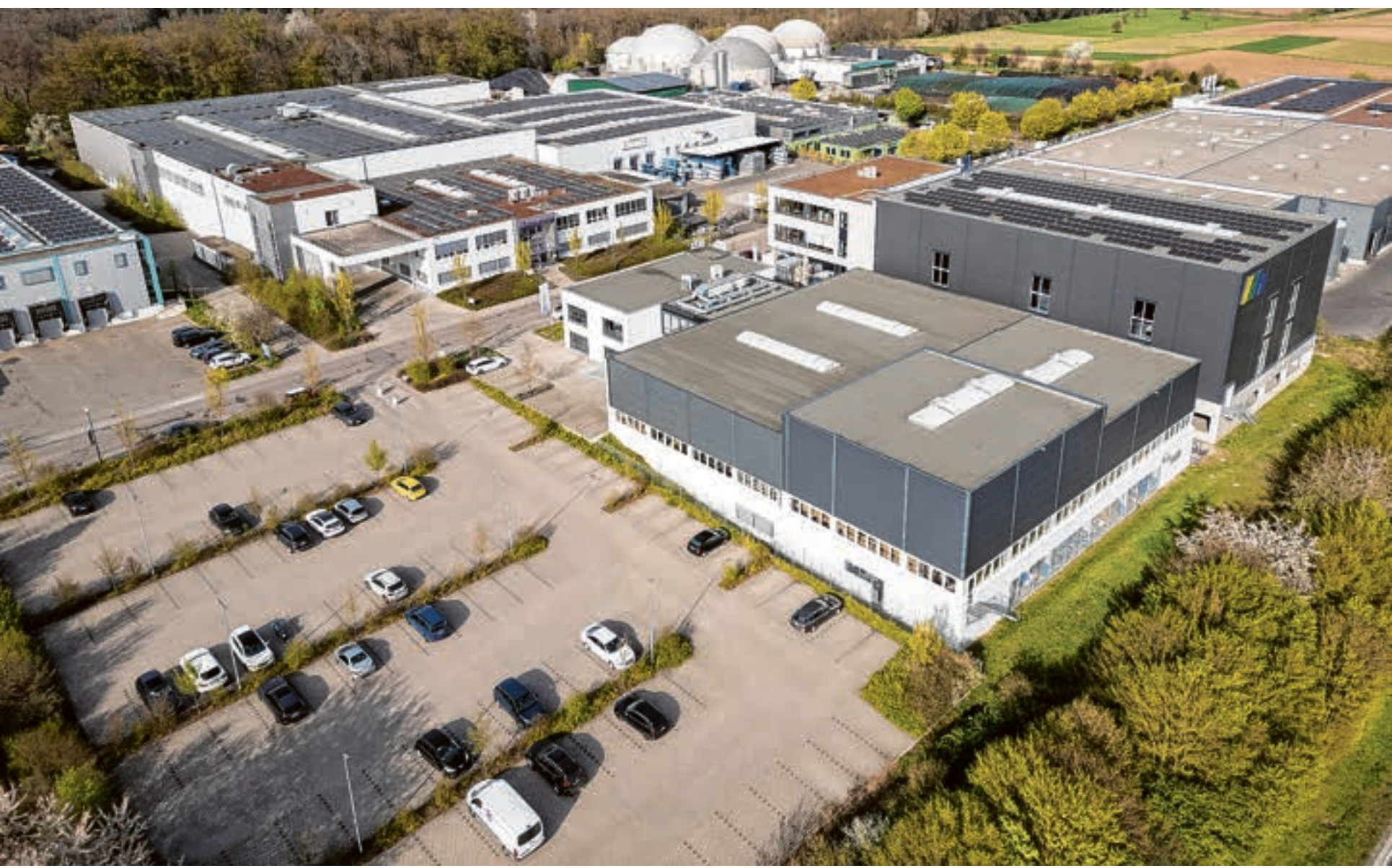
Chance auf Erweiterung: Die Firma Heidinger (im Vordergrund rechts) kann in den „Waldäckern“ mangels anderer verfügbarer Flächen auf die Parkplätze des Nachbarn BEMAG GmbH (gegenüber) ausweichen. Geplant ist eine dreigeschossige Halle mit 45 Tiefgaragenplätzen für Logistik, Büros und den Schaltschrankbau, die 2027 bezogen werden soll.